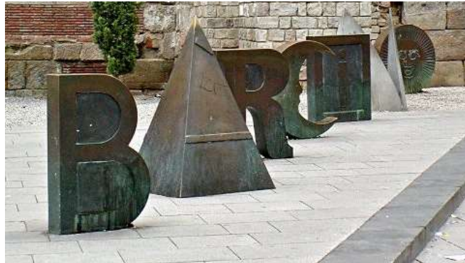
“Bàrcino” (1994) de Joan Brossa. Plaça Nova de Barcelona