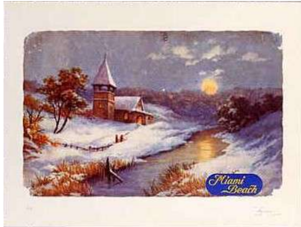
“Miami Beach” (1970-1989) de Joan Brossa