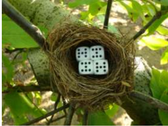
“Poema” (2009) de Sergi Quiñonero