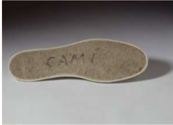
Joan Brossa, Camí , 1967-1982