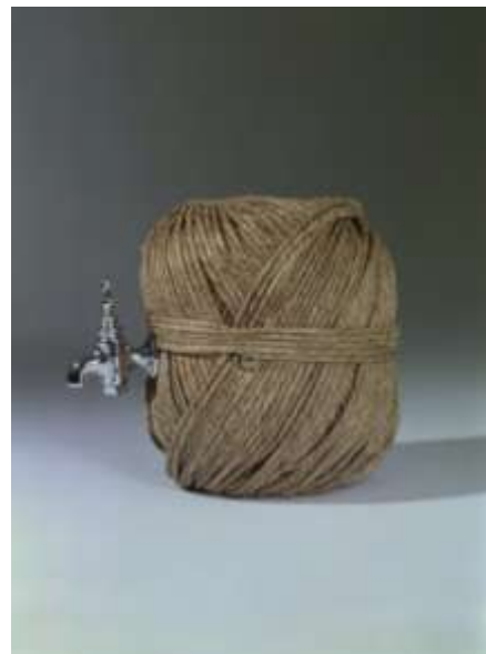
Joan Brossa, La font del cordill , 1988