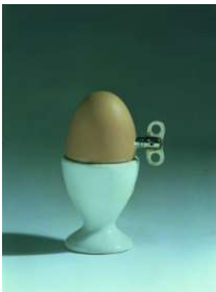
Joan Brossa, L'ou del caos , 1988