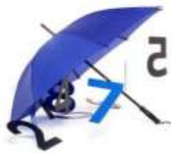
Dies de pluja