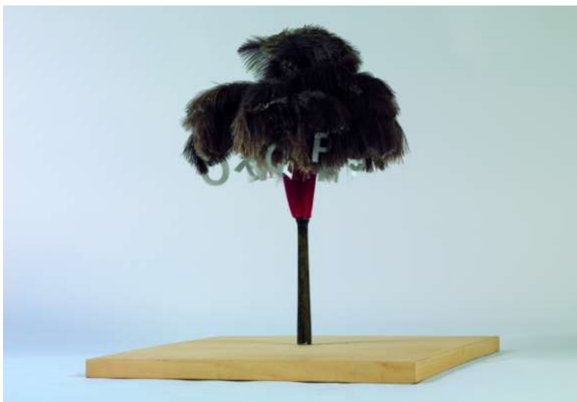
Joan Brossa, Arbre fruiter , 1988