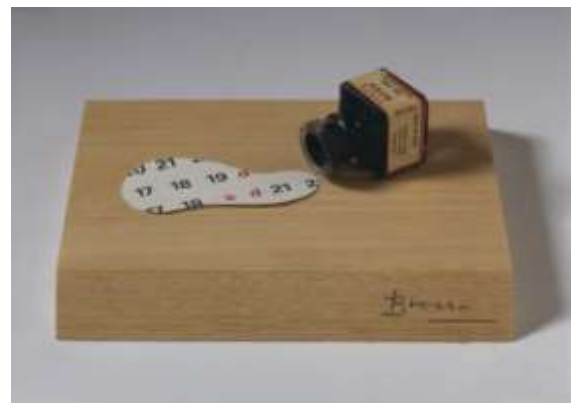
Joan Brossa, Tinter abocat , 1969