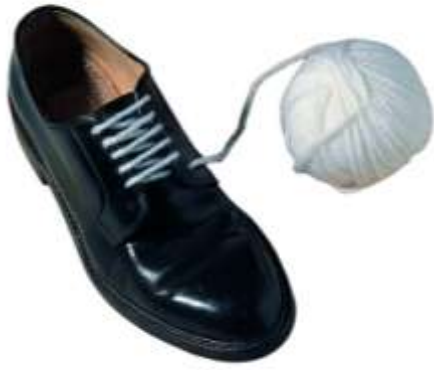
Joan Brossa, Poema objecte , 1969