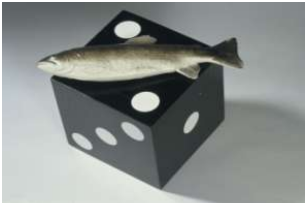
Joan Brossa, La nit del peix , 1989