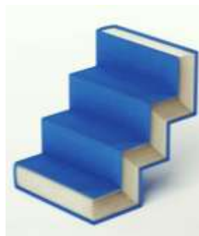
L'educació com a ascens social