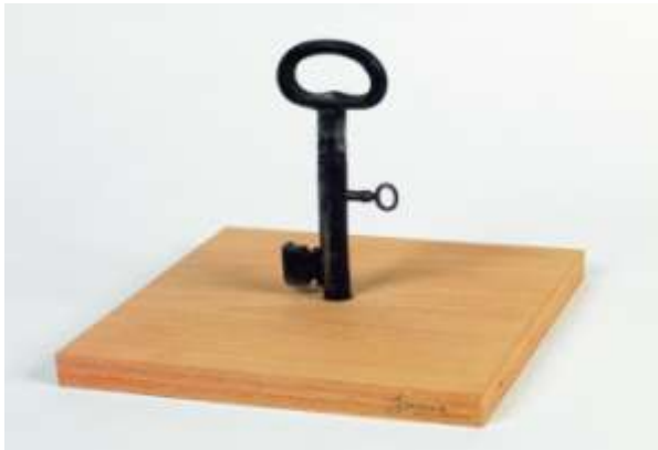
Joan Brossa, La clau de la clau , 1989