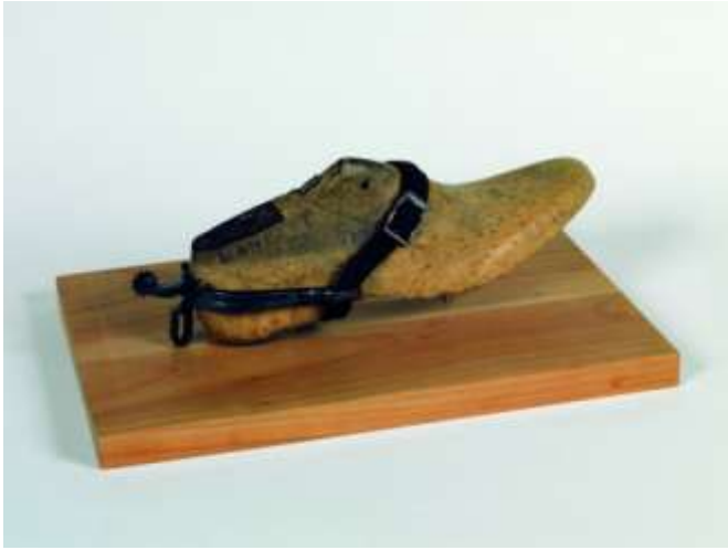
Joan Brossa, Dretà , 1988