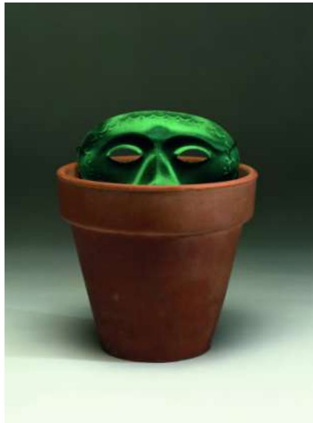
Joan Brossa, Jardiner , 1985-1988