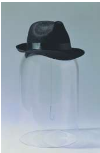
Joan Brossa, El busca-raons , 1986-1989