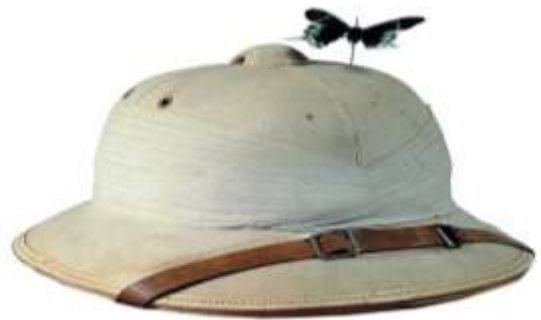
Joan Brossa, El pes del color , 1986