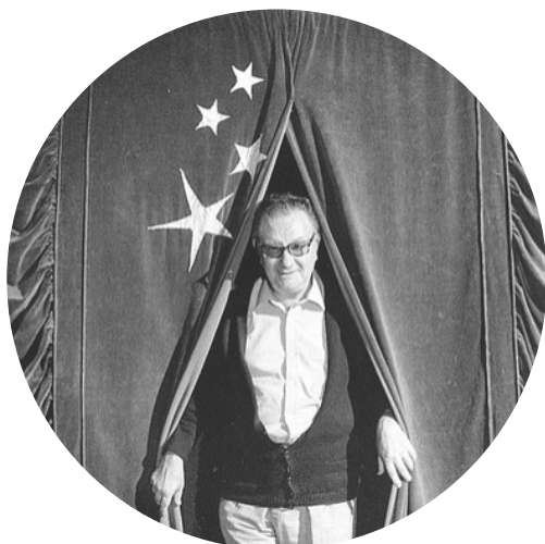
Joan Brossa a la 2ª Fira de Teatre al carrer de Tàrraga, 1982.