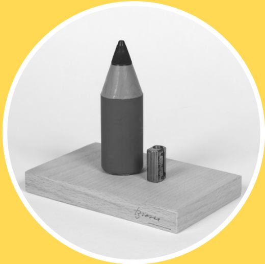
Poema objecte, 1998

«JO NO MENYSPREO PER RES EL CODI LITERARI, PERÒ PASSA QUE LES PARAULES ES GASTEN. ES TRACTA D'ESTABLIR UN L·LIGAM NOU ENTRE EL CAMP VISUAL I EL SEMÀNTIC.»